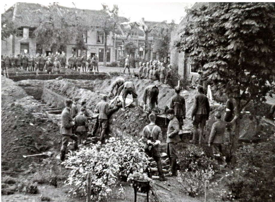
Op 15 mei 1940 werd in Valkenburg aan de Kruisweg begonnen met het begraven van gesneuvelde Duitsers in een plantsoentje voor de toren van de in de meidagen verwoeste kerk. Op de foto wordt een Duitse militair in z'n graf, in rij 2, gelegd.

De strijd om het vliegveld van Valkenburg in de meidagen van 1940 was intens geweest en had aan veel Nederlandse en Duitse militairen het leven gekost: ter plekke gesneuveld of in veldhospitelen of ziekenhuizen te Leiden, Wassenaar en Den Haag aan de verwondingen overleden. Op 15 mei 1940, daags na de Nederlandse capitulatie, werd begonnen de her en der in veldgraven begraven Duitse militairen te verzamelen en op een al dan niet provisorische begraafplaats te begraven. Ook in Valkenburg werd een provisorische begraafplaats voor gesneuvelde Duitse militairen ingericht. Hiervoor werd een plantsoentje uitgekozen aan de Kruisweg tegen de oude begraafplaats en de ruïne van de in de meidagen verwoeste kerk.